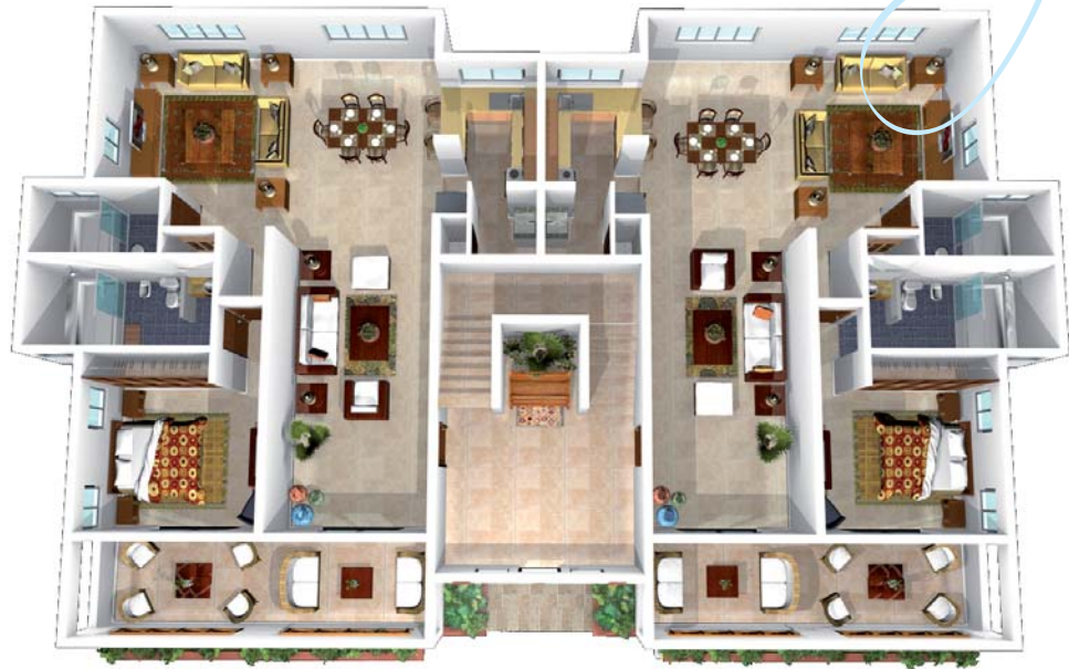
• Apartamento 1 dormitorio / Apartment 1 bedroom